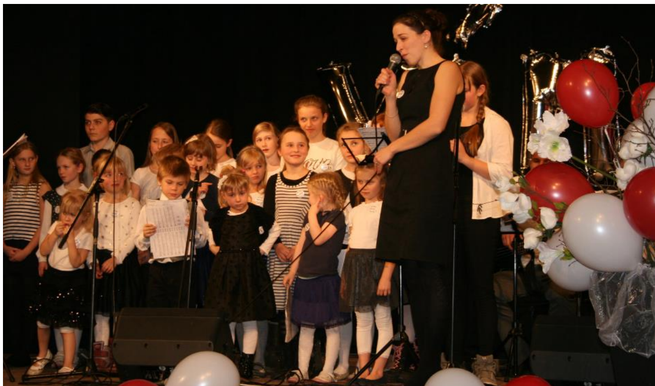
Lucie Kletečková, ilustrační obrázek: www.publicdomainpictures.com